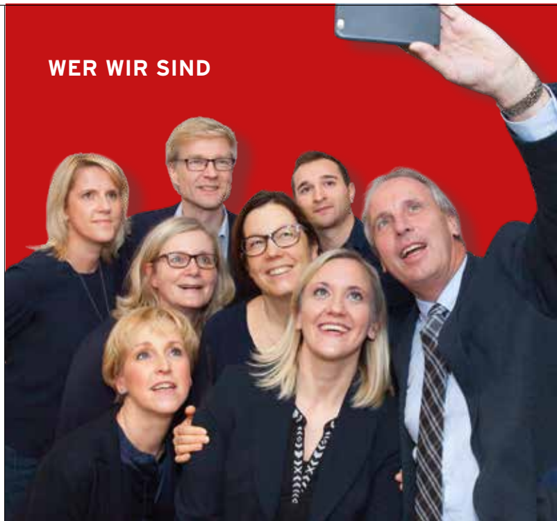
Team der Mildred Scheel Akademie Göttingen